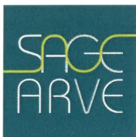
Schéma d'Aménagement de Gestion des Eaux du bassin de l'Arve